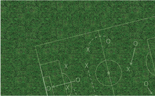
Auf gute Zusammenarbeit der Kirchen und der Politik kommt es an.

Distanz zur verfassten Kirche und sorgt nicht für eine Wiederbelebung des zurückgehenden kirchlichen Lebens. Auch ist er keine Antwort auf die Individualisierung von Lebenswelten, in denen Religion Privatsache ist. Der konfessionell-koooperative Religionsunterricht stellt vielmehr einen Antwortversuch auf drängende Probleme der demographischen und religionspädagogischen Entwicklungen dar. Ein mit Bedacht und Engagement geplanter und durchgeführter konfessionell-koooperativer Religionsunterricht im ökumenischen Geist kann als positiver Beitrag zum Bildungsauftrag von Schule in aufgeklärten Zeiten verstanden werden.