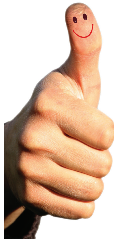
Konfessionell-kooperativ? Bisher mit guten Erfahrungen.

Für die Religionslehrkräfte, die konfessionell-kooperativ unterrichten wollen, wird daher in den begleitenden Fortbildungen