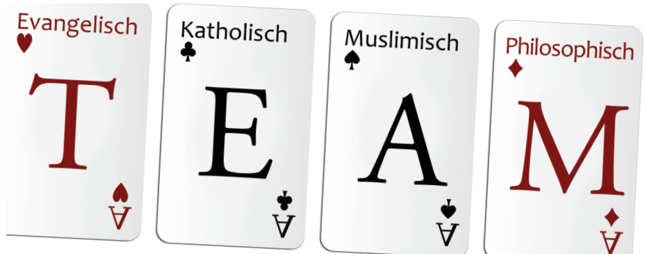
Gute Vorbereitung, klare Absprachen, gegenseitige Unterstützung.

Wie kann das Motto dieses Unterrichts „Verschiedenheit achten „Gemeinschaft stärken“ gelingen? Welche Bedeutung hat das Teamteaching und das Lernen am konkreten religiösen Vorbild für die Schüler*innen? Wie erkenne ich das Eigene im Anderen wieder – und/oder: welche Transformation und Horizonterweiterung gibt es im dialogischen, interreligiösen Lernen? Welche religiöse und weltanschauliche Identitätsbildung findet