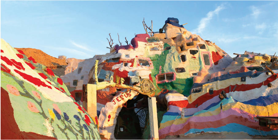
Die Buntheit und Eigenart religiöser Überzeugungen wächst.