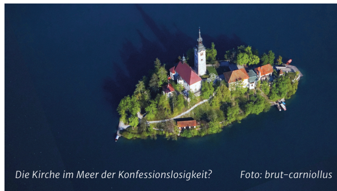
Die Kirche im Meer der Konfessionslosigkeit?