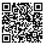
Lied zum Reinhören